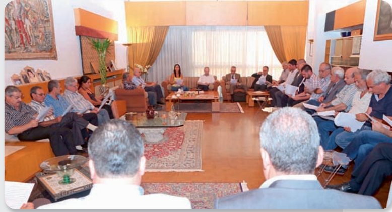
إجتماع مع وفد من بشري