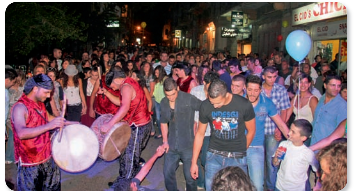
دبكة، وحشود تشارك في مهرجان حصرون