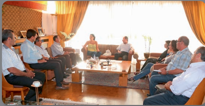
إجتماع مع بلدية برحليون