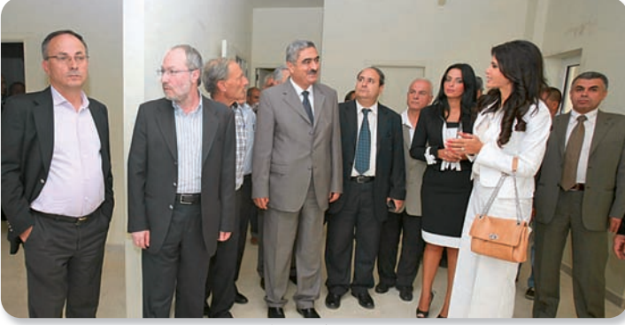
وفد وزارة الصحة يتفقد طابقي مبنى مار ماما