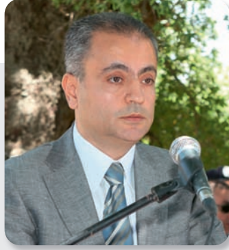
رئيس بلدية عبيدين