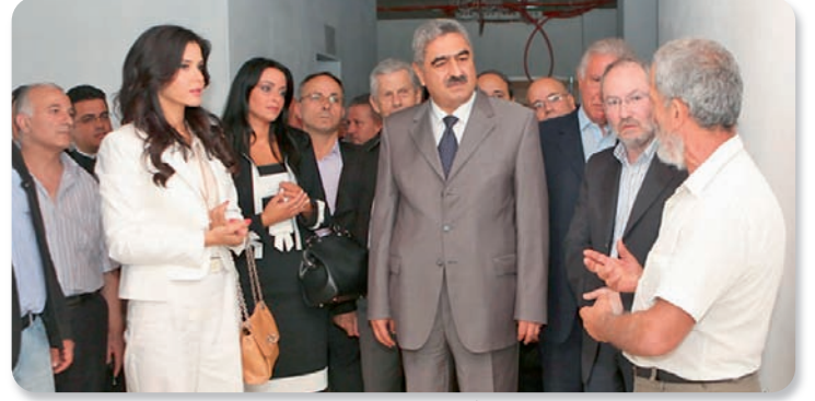
مدير عام وزارة الصحة يتفقد المستشفى الحكومي برفقة نائبي المنطقة

وباسم الحاضرين بالشكر إلى رئيس الحكومة الأستاذ نجيب ميقاتي وإلى وزير الصحة العامة الأستاذ علي حسن خليل. وأكد، في ختام كلمته، أن «القوات اللبنانية»، ورغم الظروف الصعبة، مصممة على النهوض بشري وبالجمّة. ثم ألقى الدكتور وليد عمار كلمة جاء فيها: «يسعدني أن أمثّل معالي وزير الصحة علي حسن خليل في هذه المناسبة لإطلاق العمل بتأهيل المبنى الملحق بمستشفى بشري الحكومي، وهي خطوة من شأنها تطوير العمل في المستشفى، ما سيؤدي إلى زيادة عدد الأسرة ليصبح ٣٥ عند انتهاء المشروع، تخصّص لاستيعاب الحالات الاضافية ولاستقبال الحالات المرضية للاقامة الطويلة، بما يلبي احتياجات منطقة بشري والقرى المجاورة، ويوفّر العناية اللازمة للأهالي. إن وزارة الصحة تسعى إلى تعميم الاستشفاء الحكومي في المناطق الريفية، ولقد قامت بالتنسيق مع نواب هذه المنطقة وفعاليتها بتطوير مستشفى بشري الحكومي وتجهيزه لتأمين الخدمات الصحية والتشخيصية المناسبة. كما قامت، بعد موافقة مجلس الوزراء بالتعاون مع مجلس إدارة المستشفى، باستئجار المبنى الجديد لإلحاقه بالمستشفى الأساسي، وهي تتابع إيجاد الوسائل والموارد بحيث يكلف مجلس الإنماء والإعمار بإنجاز عمل التأهيل والتجهيز، وتقدر الكلفة بمليار وثمانمئة ألف ليرة لبنانية. وانطلاقاً من رؤية الوزارة لتعزيز المستشفيات الحكومية وتطويرها، تمّ اعتماد آلية لاستقلالية