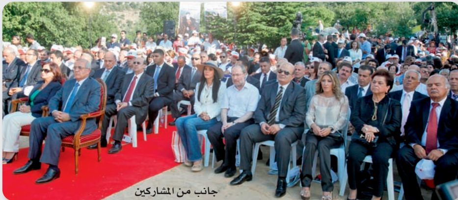
جانب من المشاركين

أن يستلهم أهلنا في جبّة بشري بشكل خاص، وحزب القوات اللبنانية بشكل عام، وادي قنوبين ومسيرة البطارقة في طروحاتهم الوطنية وعيشتهم اليومي، فهم لا يقبلون أبداً التفريط بأي ذرّة من تراب لبنان، ولا بأي مبدأ من المبادئ السيادية، ولا بأي موقع من المواقع الرئيسية، التي يقوم عليها لبنان، وفي مقدّمها موقع رئاسة الجمهورية وموقع البطريركية المارونية». وطمأنت ججع الفياري بالقول: «إطمئنا، إن القوات اللبنانية ابنة الكنيسة. هكذا كانت، وهكذا هي اليوم، وهكذا ستبقى غداً، والمصطادون في الماء العكر لن ينجحوا في رهاناتهم. ولولا إيماننا، ولولا انتماؤنا الروحي إلى كنيسة، التي كانت وراء لبنان الدولة والكيان بحدوده الحاضرة، لما كان لنضالنا معنى».