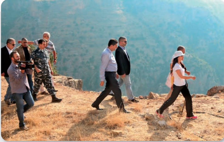
تعاين قطعة الأرض في مار جرجس