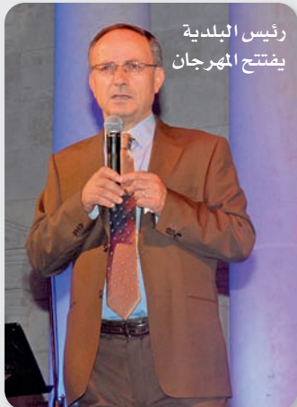
رئيس البلدية يفتتح المهرجان