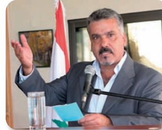
رئيس بلدية بقراقاش