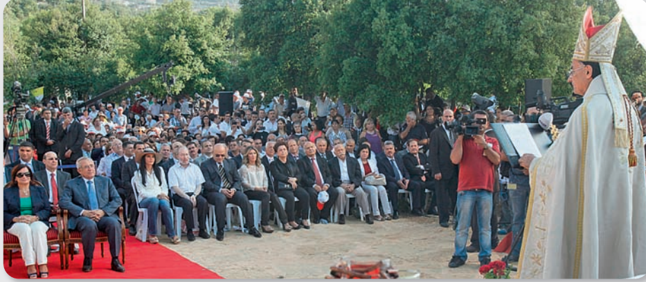
البطريك الراعي يلقي عظة

لبنان أي صراع داخلي. وفي ذلك، يهمني أن أعلن أننا إلى جانبكم، ونطلب من الله أن يمدكم بالحكمة الضرورية لتجاوز المرحلة الدقيقة والصعبة التي يمر بها لبنان». وقالت: «إن مجرّد الوقفة على مدخل الوادي المقدس، تُشعر الانسان برهبة ومهابة، فكم بالحري عندما نحبي ونحیی ذكرى البطارقة في حديقتهم. فالبطارقة الموارنة أضافوا إلى تاريخ الوادي تاريخاً مجيداً مكللاً بالنضال والبطولة والایمان والكرامة والحرية حتى الشهادة، وإذا كنّا هنا في مدينة حديقة البطارقة، فلأن هذه الحديقة هي جزء من الوادي المقدس الذي يصحّ فيه القول: «إنه حديقة الرب على الأرض»، كيف لا، وعلى مطله، يربض أرز الرب الذي افتداه ويفتديه أبناء الجبّة بأرواحهم، وبين صخوره ذخائر القديسين والنسك والبطارقة الكبار». واذ لفتت إلى أنه «من مدعاة فخرنا واعتزازنا،