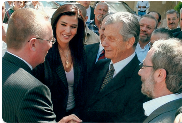
يستقبل السفير الأميركي فيلتمان في بشري إلى جانب نائب المنطقة

إن المرحوم والدي رسم حدود بشري، وكان يقول لنا: «إن حدود بشري العقارية تصل إلى سكة حمص». أجدادنا كانوا أصحاب باع كبير، وأبطال، لأنهم رسموا حدود بشري باتجاه المقلين، وهذه عظمة بشري وقوتها. لكن للأسف امتدّت الأيدي على المشاعات، وحصلت