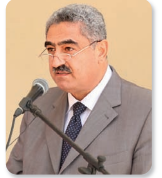
مدير عام وزارة الصحة يلقي كلمة

بعد جهود متواصلة مع دولة رئيس الحكومة الأستاذ نجيب ميقاتي ووزير الصحة العامة الأستاذ علي حسن خليل، توصل نائبا منطقة بشري إلى تأمين مبلغ مليار وثمانمئة ألف ليرة لبنانية خصّص لتأهيل طابقيين في مبنى مار ماما، ملحقين بمستشفى بشري الحكومي. ولهذه الغاية، استقبل النائبان ججع وكيروز أمس وفداً من وزارة الصحة العامة ضمّ: الدكتور وليد عمار مدير عام وزارة الصحة ممثلاً وزير