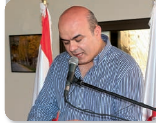
رئيس بلدية بقاعكفرا