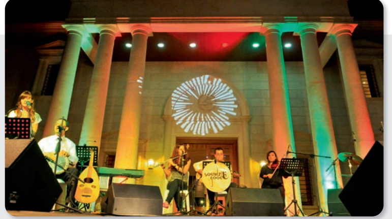
فرقة Sound good