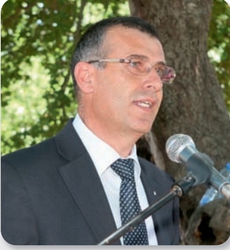
رئيس بلدية برحليون