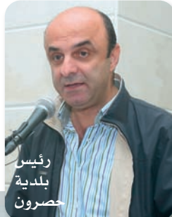
رئيس بلدية حصرون