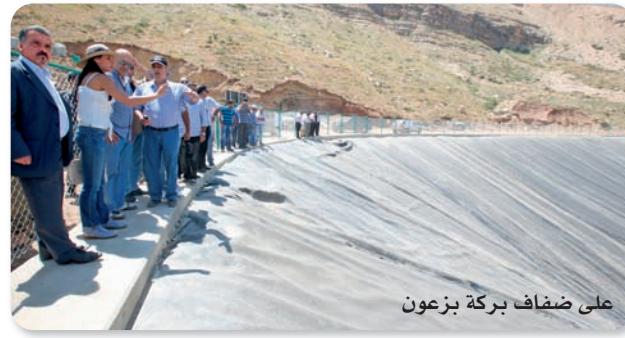
على ضفاف بركة بزعون

وجودنا وهويتنا، وجزء أساسي من الوجدان التاريخي الماروني على قاعدة الارتباط الوثيق بين المقاومة التاريخية والأرض. وأشاد كيروز بالدور الأساسي لاتحاد بلديات جبّة بشري في تحقيق هذا الانجاز المهم، من خلال ما قدّمه من تمويل واهتمام وتعاون، كما نحيي أهلنا في بزعون وبقرقاشا، أملين في أن نتّمكّن من تحقيق المزيد من الإنجازات، وندعورفاقنا في البلديتين إلى السعي بكل جدية لخلق ديناميّة