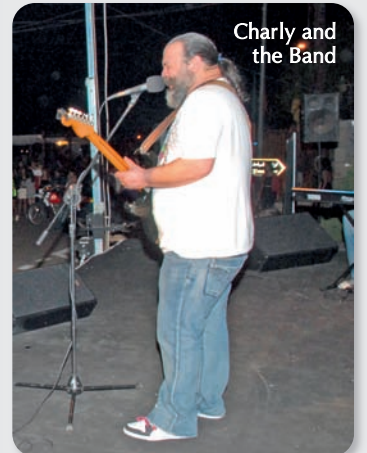
Charly and the Band