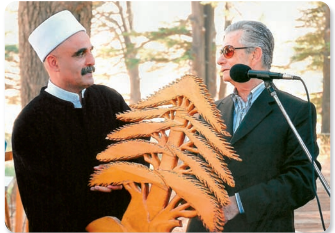
يكزم رئيس الوفد الدرزي الذي زار الأرز

هذا المخطّط هو مخطّط تهجيرى بامتياز، وباختصار، كلّفَتْ مجموعة من مهندسي بشري لدرس المخطّط، ووضع دراسة منطقيّة تحفظ حقوق أهلنا في بشري. ونسقتُ مع الاتحاد ورؤساء البلديات في المنطقة الذين كانوا يعانون معاناتنا نفسها، وقدمنا دراسة جديدة إلى المجلس الأعلى للتنظيم المدني، ونحن بانتظار بتّها والموافقة عليها. أمّا في ما يتعلّق بالمخطّط التوجيهي لمنطقة