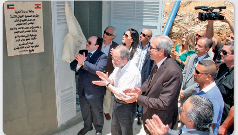
إزاحة الستارة عن اللوحة التذكارية