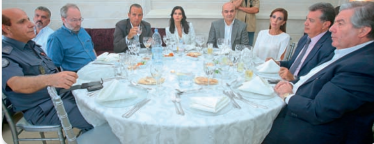
الرسميين على طاولة الغداء في منزل رئيس بلدية بقاعكفرا