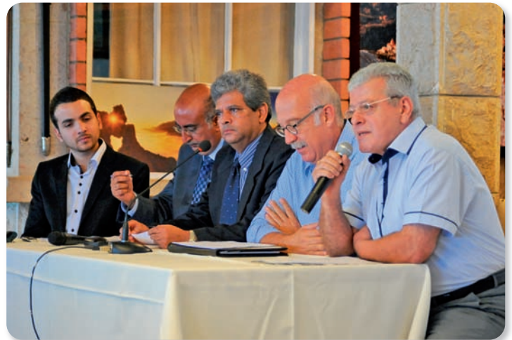
محاضرة حول المكسيك والعلاقات التجارية المتبادلة مع لبنان