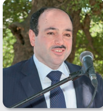
الممثل المقيم للصندوق الكويتي في لبنان