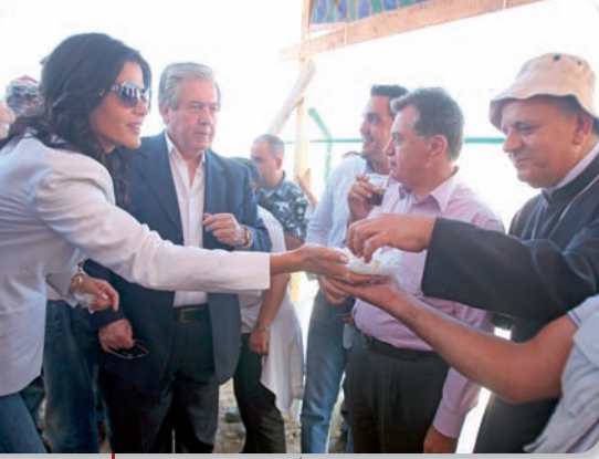
على ضفاف بركة حصرون

وتابعت: «اذا كان تأمين الطرقات والاستشفاء والصرف الصحي والكهرباء والهاتف من متطلبات التجذر فإن توفير المياه هو من ابرز الاولويات فصحيح أن منطقة بشري غنية بالمياه لكن ما نقوم به هو ترشيد استهلاكها واستثمارها وتجميعها لتعزيز القطاع الزراعي وري البساتين الموجودة وتشجيع المزارعين على استصلاح المزيد من الاراضي لأن الزراعة هي مورد اساسي للعيش الكريم في المنطقة وخصوصا في بقاعكفرا