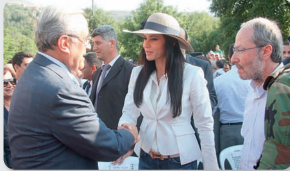
سلام متبادل بين الرئيس ونائبي المنطقة